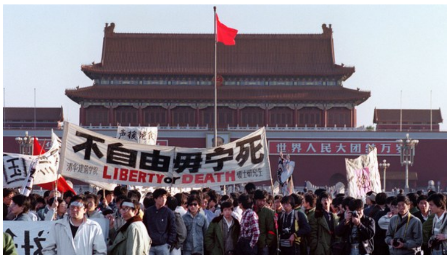
图 2: 受煽动的学生群体冲击天安门

在以方励之等人为首的，支持全面西化的自由派的煽动下，在全国范围内发生了一系列所谓“追求民主”的抗议游行活动，给我们的党和国家造成了巨大的伤害。 [谭 16] 这些看似追求改造中国社会的尝试，在一些反党分子的引导下，无不向着抨击社会主义制度的方向进行下去。到 1988—1989 年间，资产阶级自由主义者更是毫无忌惮，到处发表演讲，散发传单，公然反对四项基本原则。在北京建立非法组织，煽动不明情况的大学生进行非法的集会、游行、示威活动，最终发展成为反革命暴乱。面对这一复杂局面，党中央给予了及时果断的有力回击，平息了这场可能毁灭中国社会主义的政治事件。邓小平同志明确指出：“这次事件的性质，就是资产阶级自由化和四个坚持的对立”。 [中 93]