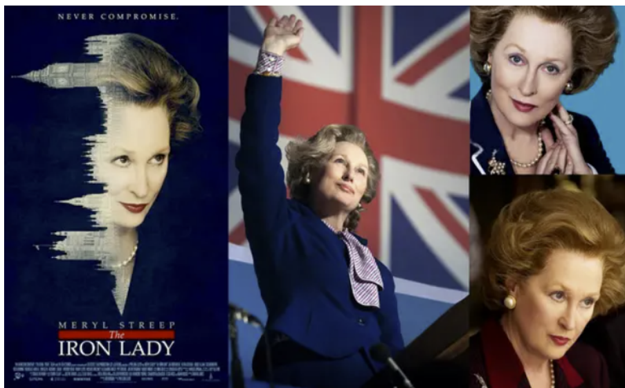
图 1: 电影《铁娘子·坚固柔情》

新自由主义基本继承了以亚当斯密为代表的古典自由主义学派思想，是一种具有严重个人倾向的自由主义，其强调私有财产神圣不可侵犯，强调个人在市场上有追求自身利益的最大自由。他鼓励极右的政府，不以任何手段干预市场“无形的手”。在上世纪七十年代苏攻美守的大背景下，铁幕两侧一度采取过缓和的方针，美国政界主流的认识是苏联会是一个“千年帝国”，会在长时间内与美国形成竞争态势。可随着苏联所支持的社会主义阵营的实例越来越强，全球革命形式高歌猛进，以美国为首的资本主义国家认识到，苏联从没有想过与他们共存，而是要趁你病，要你命。在资本主义阵营逐渐从两次石油危机的重创后恢复过来，他们再也不能容忍苏联势力的扩张，而新自由主义在此时乘风而起。以英国的撒切尔政府和美国的里根政府为代表的新自由主义经济学派大肆鼓吹市场“无形之手”的作用，用最赤裸的语言攻击与新自由主义天然敌对的共产主义思想，并在全球开始了思想范围内的反攻。 2